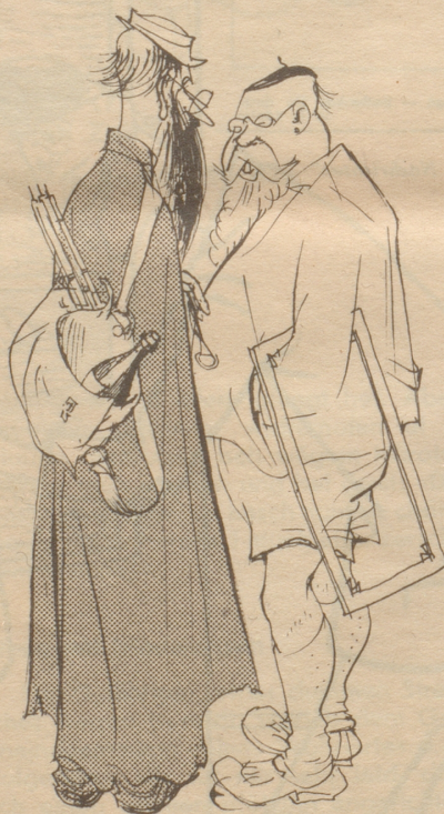
«Um gut zu malen brauche ich vor allem zwei Dinge: Gute Leinwand und guten Landwein!»

In einer Geographiestunde an einer Mittelschule bringt der Lehrer folgenden drastischen Beweis dafür, daß es im Mittelland Wasserläufe gibt, deren Wassermenge durch Versickern abnimmt, sie also am Oberlauf mehr Wasser führen als am Unterlauf: «Es hat einmal eine Zeit gegeben, in der die Wina vollkommen trocken in die Suhre floß.»