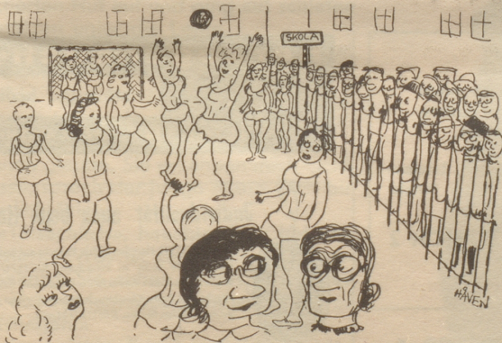
„Es ist wirklich erfreulich zu sehen, welches Interesse jedermann für den Sport der Schuljugend zeigt.“