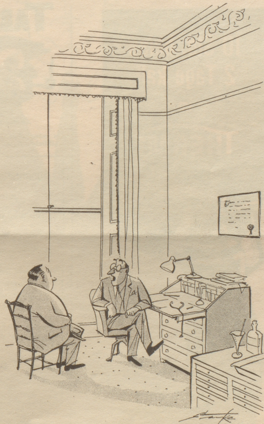
„Fahren Sie fort mit den Beugungsübungen, marschieren Sie aufrecht und kaufen Sie einen netten, gut geschnittenen Anzug mit senkrechten Streifen.“