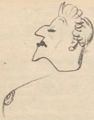
« Das ischt kei Modeschau — das ischt en Alpuzug! »