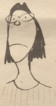
« En Ärmelschurz isch jedefalls s Aschtändigstcht! »

Nachschrift: Von mir nicht bemerkt hat meine Frau den Fragebrief mitgelesen und flüstert mir über die Achsel (mit Trägern!) zu: «Fischbein, Lieber, Fischbeinstäbchen!» — womit obige Anfrage keiner Antwort bedarf.