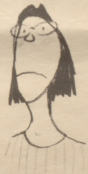
« En Ärmelschurz isch jedefalls s Aschtändigscht! »

Nachschrift: Von mir nicht bemerkt hat meine Frau den Fragebrief mitgelesen und flüstert mir über die Achsel (mit Trägern!) zu: «Fischbein, Lieber, Fischbeinstäbchen!» — womit obige Anfrage keiner Antwort bedarf.