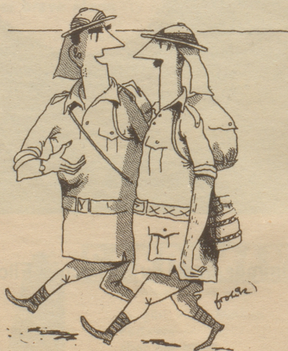
«Es ist ein grausamer Zehn-Tage-Marsch, aber es lohnt sich wegen der wunderbaren Fata Morgana!»

Um 7 Uhr früh fuhren wir los. Zuerst in ein Waisenhaus. Da sind sie nämlich schon früh auf. Wir mußten nur etwas warten, weil der Waisenvater noch am Rasieren war. «Muskatreiber?» sagte er, «leider nicht, meine Herren; in diesem Hause verwenden wir prinzipiell keine Gewürze. Wie? Nein, auch keine Muskatnüsse – prinzipiell nicht!»