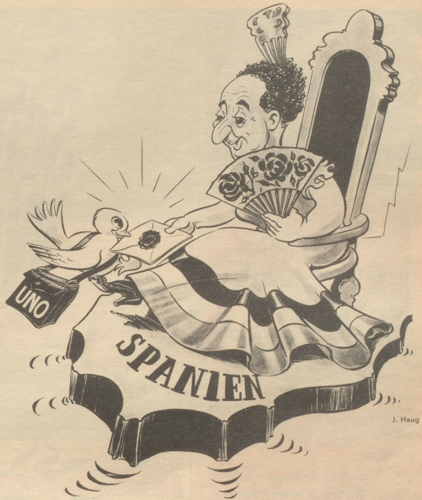
Spanien wird Uno-fähig