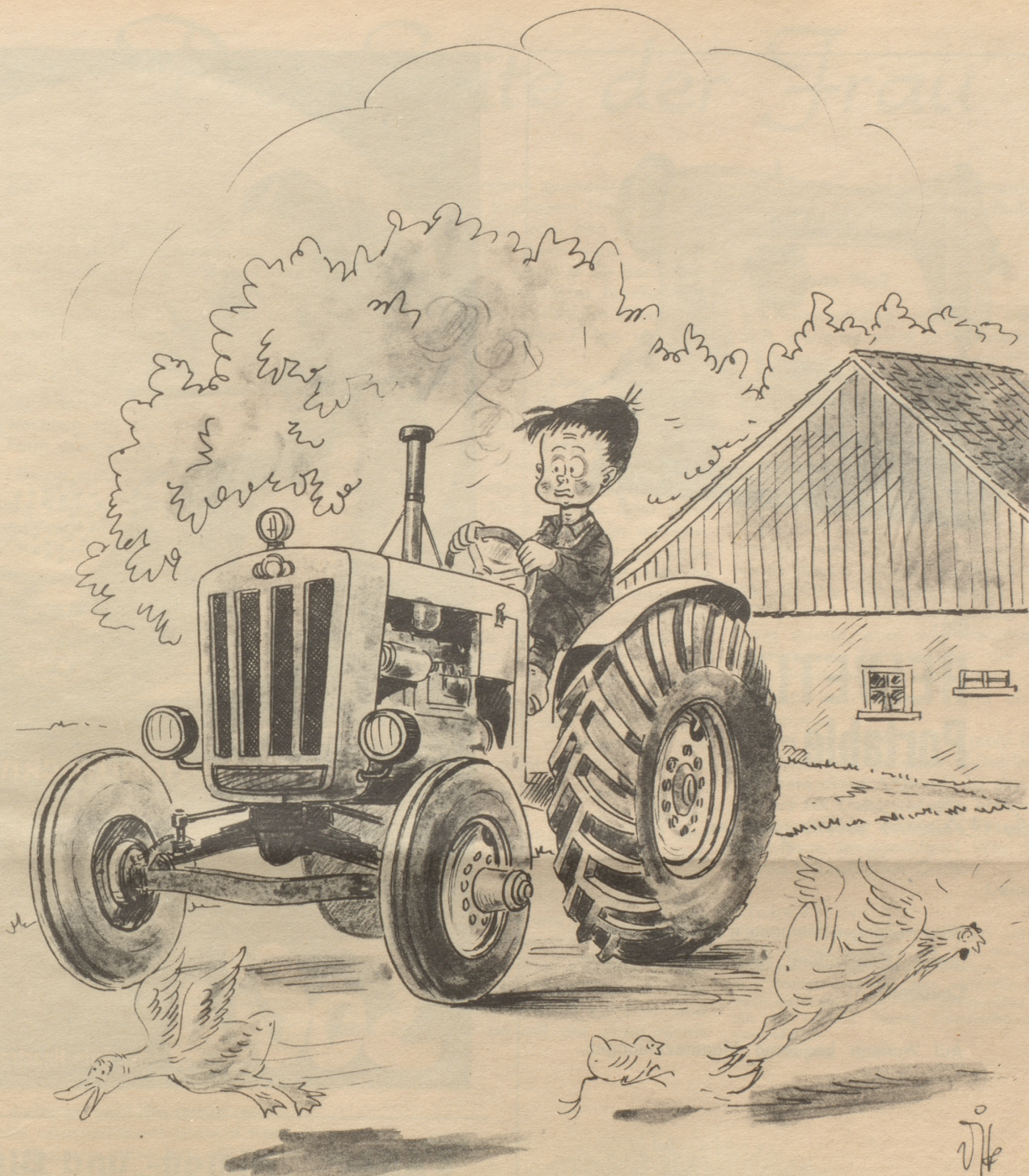
Jugendliche auf Landwirtschafts-Traktoren

„Wänn dänn de Chlii us dr Chägelschuel heichunnt chann er mich ablöse, so chann ich d Uufgabe go mache!“