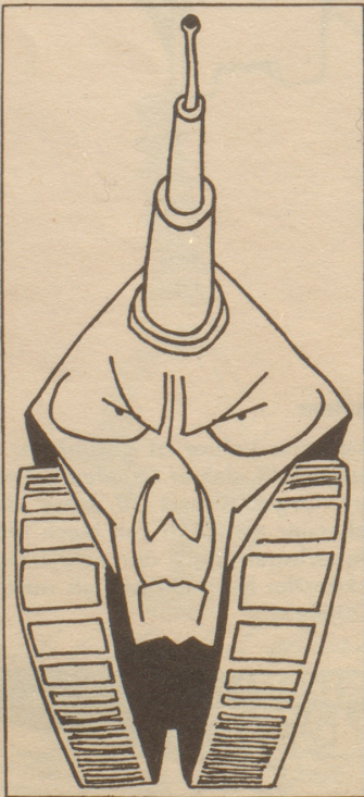
ADENAUER (Süddeutsche Zeitung)