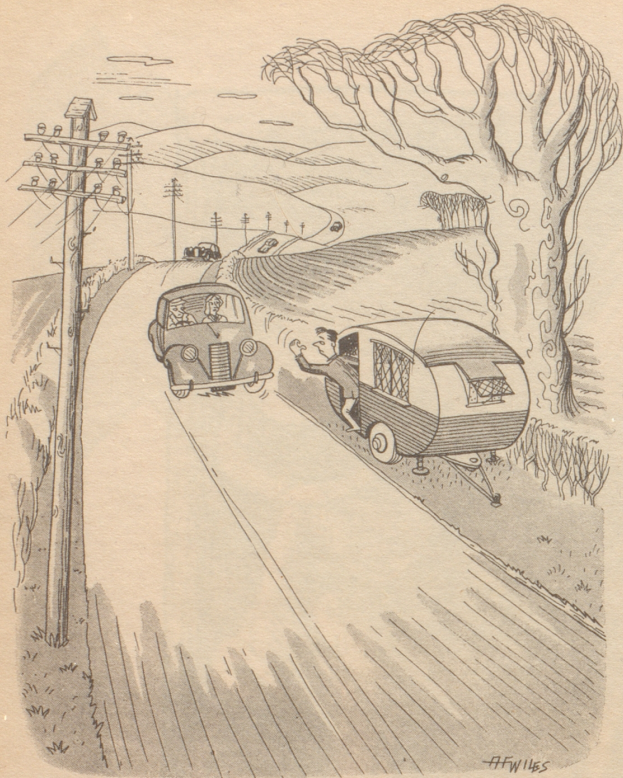
Autostop — einmal etwas anders