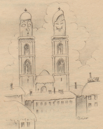
„Wie hät au dä sini Chappe wider uf!“

Nach der Vorfred' schweren Lasten, Freun wir, wenn Geschenke gasten, Daß wir nicht mehr müssen fasten, — Weil des Baumes Lichter fasten, Wollen wir ein bißchen glasten, Von dem mühevollen rasten, Und darauf (mit vollen Hasten, — In das neue Jahr uns kasten.) PF