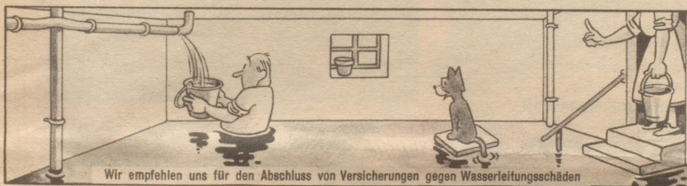
Wir empfehlen uns für den Abschluss von Versicherungen gegen Wasserleitungsschäden

Ein Wort aus Pestalozzis fröhlichem Herzen.