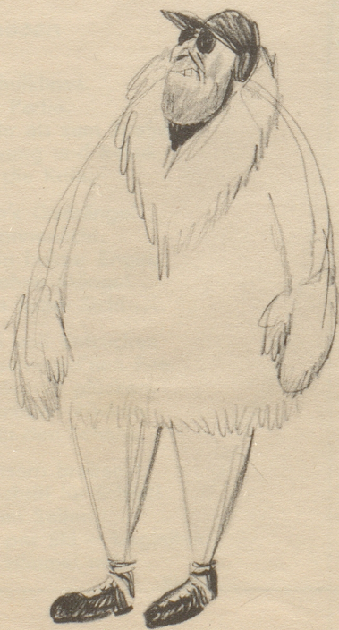
„Was choscht das Kaff?“

An der Portierloge mußte ich warten, denn der Eishockey-Internationale tele-