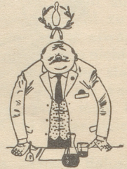
« Landbote », Winterthur.

Wir haben hier ein humorvolles Schirnbild-Verfahren, das im unerbittlichen Röntgenbild unsere kleinen und großen Lächerlichkeiten und die schadhafte Stellen an unserem Volkskörper an den Tag bringt. Aber Böckli reißt uns nicht mit hämischer Geste den Heiligenschein von der helvetischen Glatze, seine Karikatur hat einen sanften Unterton des lächelnden Witzes, der nicht verletzen, sondern bloß enthüllen will. Wenn er uns den Spiegel des Schweizerisch-Allzuschweizerischen vorhält, grinst uns daraus nicht ein bissiges, ätzendes Zerrbild entgegen, sondern einfach das Konterfei des Seldwylers, das uns nicht ärgern, sondern bessern will... Witzinhalt und Witzbild sind eine Einheit, man weiß nicht, was zuerst entsteht. Es weht eine klare Luft um diese Karikaturen, nichts von Bieder-Biertischhaftem, nichts von Unappetitlich-Familiärem, keine widerlichen Ehewitze, keine lüsternen Anspielungen; man darf sagen, daß diese Bilder etwas von der sauberen Parodierart Bernard Shaws haben.