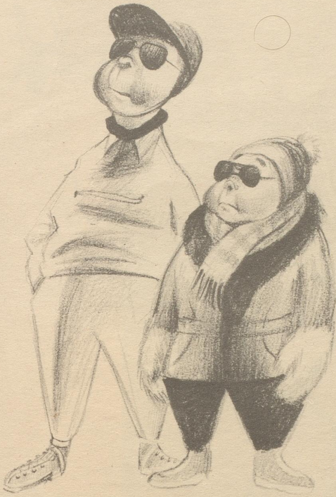
„Daß die Purechind mit söttige liederliche Ustrüchtige überhaupt Schiifaare chöned!“