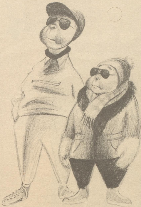
„Daß die Purechind mit söttige liederliche Ustrüchtige überhaupt Schiifaare chöned!“