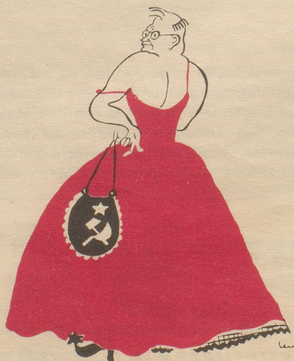
Wjatschinskij zeigt die kalte Schulter

In der Maturaklasse liest Käthi vor der Klasse stehend aus einem Buche vor. Anscheinend spricht sie leise, denn viele Mitschüler haben Mühe, sie zu verstehen. Auch dem Lehrer geht es so und darum unterbricht er: «Käthi, lesen Sie doch bitte lauter. Die ganze Klasse hängt an Ihren Lippen!» – Die Knaben lächeln, Käthi wird krebsrot und der Professor weiß nicht, warum ihn alle so dumm anschauen. WSO