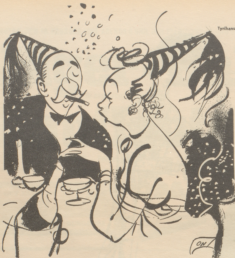
Die Scheinheilige: „d Muetter hät mr erlaubt bis am zwölfi uufzblübel!“