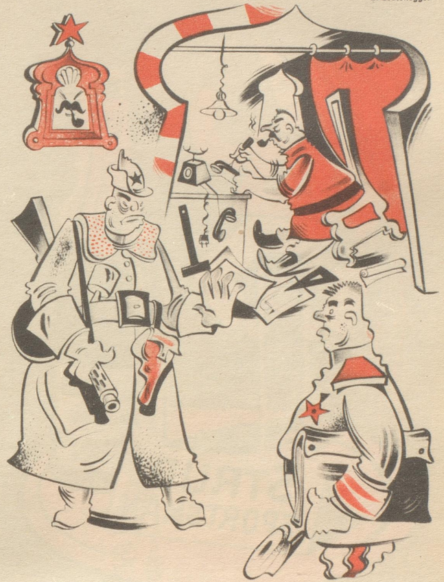
„Genosse Stalin gibt heute keine Audienz. Er ist eben im Begriff, das Telefon zu erfinden, Genosse Volkskommissär!“