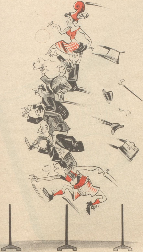
Bisher hat, wenn auch mit großer Mühe, Bidault alle Hindernisse genommen.