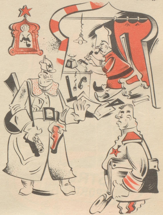
„Genosse Stalin gibt heute keine Audienz. Er ist eben im Begriff, das Telefon zu erfinden, Genosse Volkskommissär!“