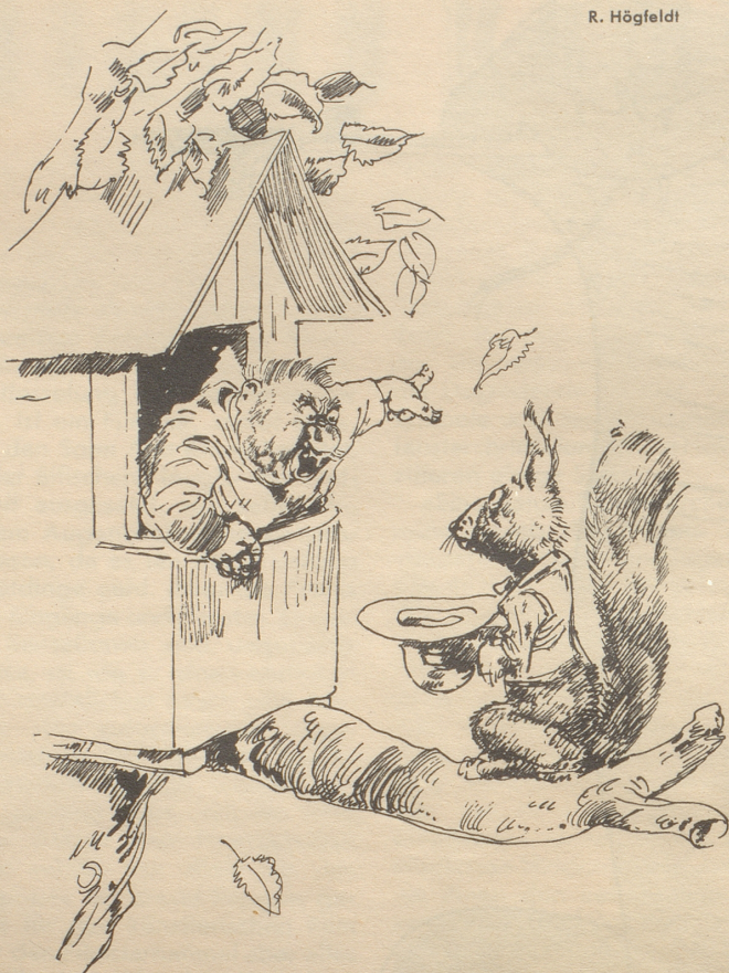
„Wenden Sie sich an die öffentliche Wohlfahrt!“