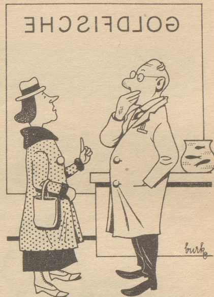
„Hänzi großi Goldfische? es wär für vier Persone?“

Warum rennen unsere jungen Leute ins Kino und auf die Sportplätze? Ha, ich glaube, sie wollen nach all dem Chranpf der Tagesarbeit einmal