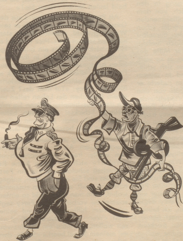
Hollywood versucht, MacArthur als Filmschauspieler zu gewinnen