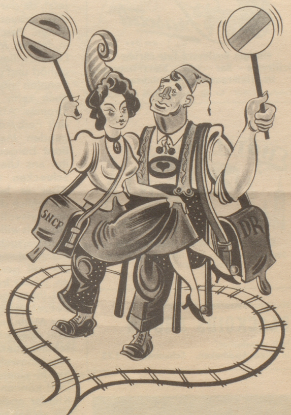
Eisenbahnpool zwischen Frankreich und Deutschland. Das Verhältnis wird ja immer vielversprechender!