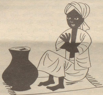
Dass Inder Indianer sind, behauptet nur, wer farbenblind.