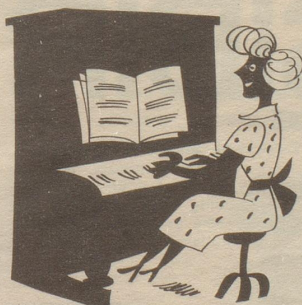
Das Istrument, auf dem sie spielt, hat sie durchs grosse Los erzielt!