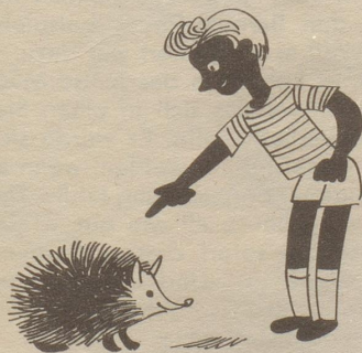
Der Igel ist, das wissen wir, der Inbegriff vom Stacheltier.