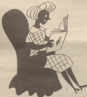
Ich lese immer mit Genuss „Die Kraniche des Ibykus“.