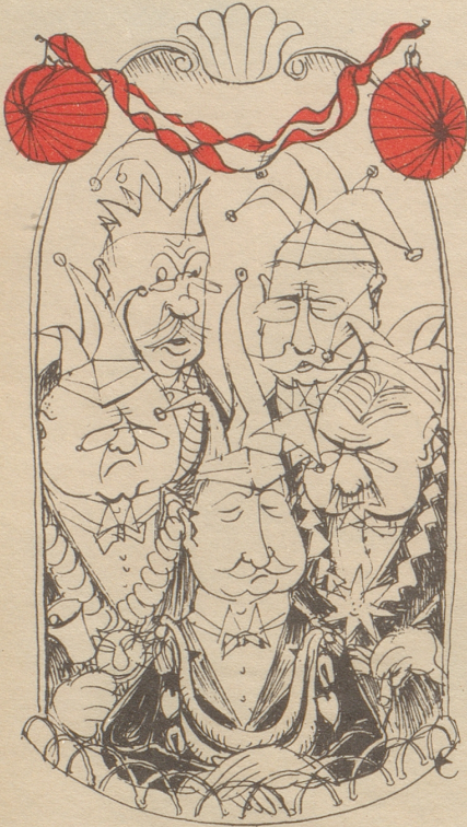
Fasnacht bi Eus