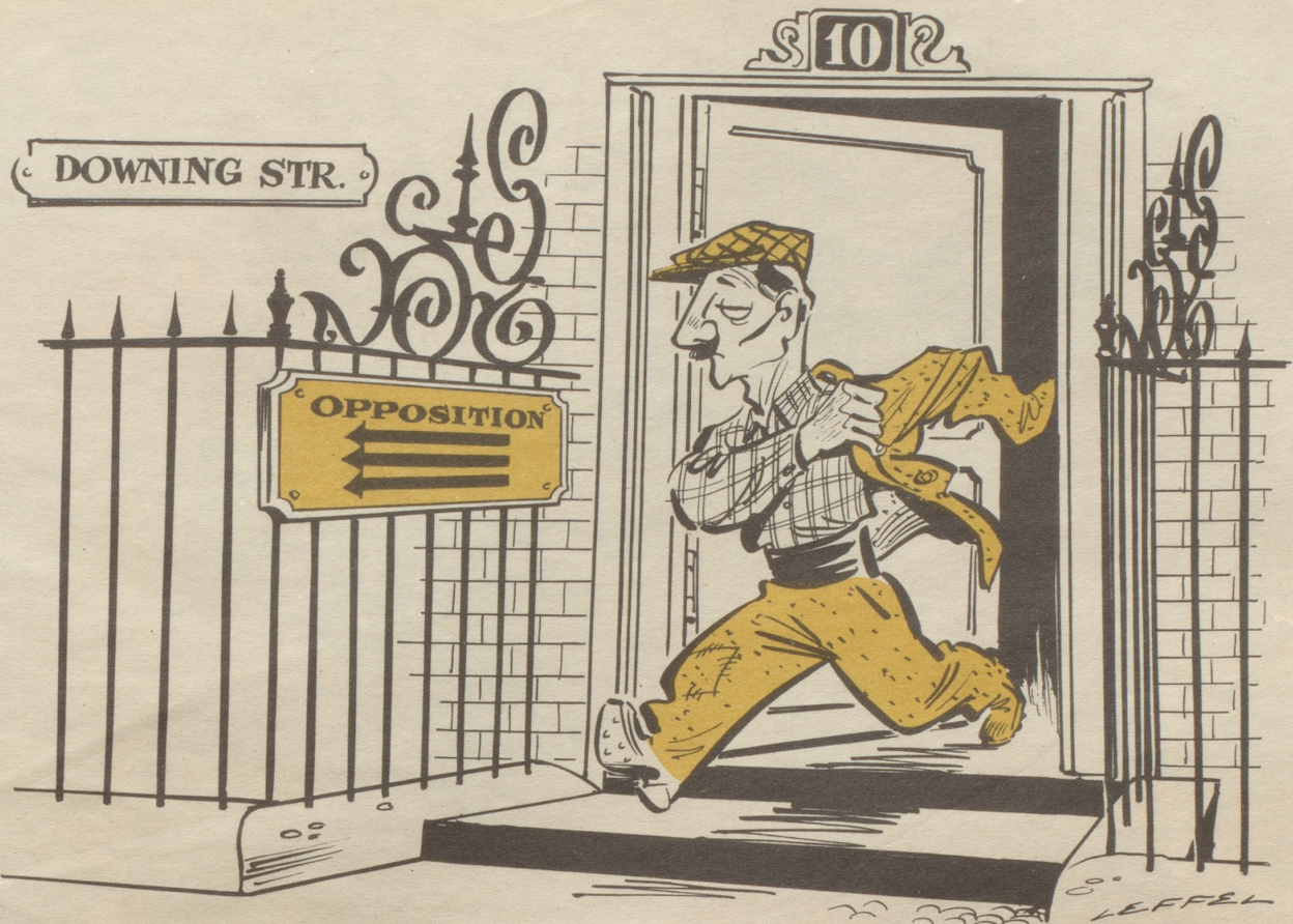
Der Weg zurück

kommen sei. Die Note habe in einem Notizbüchlein aus der Weste herausgeschaut, welche der Wirt an die Stalltüre gehängt habe. Er habe sie nur anschauen wollen, aber da sei jemand gekommen und er habe sie dann halt schnell in seinen Sack gesteckt. Also sicher, er habe sie wirklich gar nicht stehlen wollen — die Hellseherin habe es ja selber gesagt —, und ich soll doch so gut sein und die Sache wieder in Ordnung bringen, ohne daß jemand etwas merke. Und ich soll ihn bitte ja nicht verraten, er wüßte gar nicht was er sich sonst anfüte. — Nun, ich habe ihn nicht verraten. Große Augen machte aber andern Tages der Wirt, als er unter seinem Suppenteller die Note fand. Bei einer Flasche Wein haben wir dann am Abend das Happy-End gefeiert. Und als ich auf eine entsprechende Frage des Wirtes