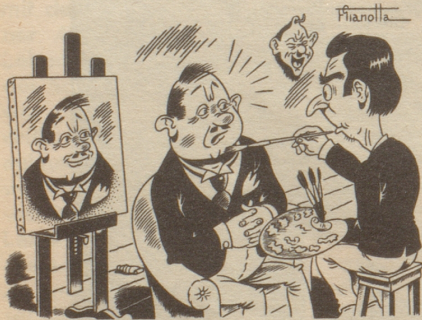
«I mueß na e bitzli an Irem Gsicht ändere das s Porträ schtimmt.»