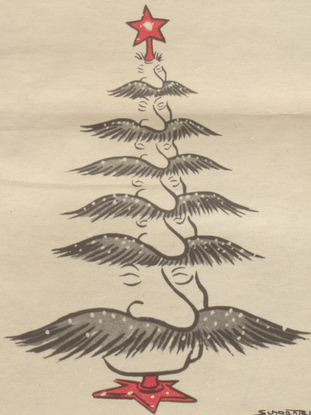
Weihnachtsbaum in Ostdeutschland

Der Nebelspalter-Verlag in Rorschach liefert Ihnen die Bücher mit Kassette ohne Aufschlag zu den normalen Preisen.