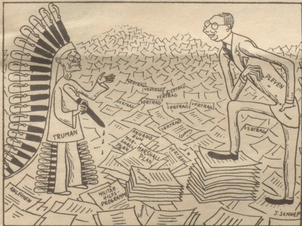
Ich habe die Federn durch Füllfedern ersetzt! Figaro

(Wie verlautet, bestehen Pläne, im unteren Rhonetal den Reisanbau zu versuchen.)