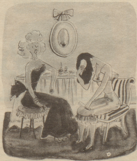
«Eines muß ich ihm lassen: Er hat Geld, sieht gut aus und ist intelligent.» Collier's

Warum sind Männer keine Herzöge? Vielleicht, weil sie vernünftigerweise lieber etwas Billigeres verkaufen als gar nichts. Vielleicht sehen sie auch allesamt ein, daß man trotzdem nett sein kann miteinander (was ja auch bei den meisten Verkäuferin-