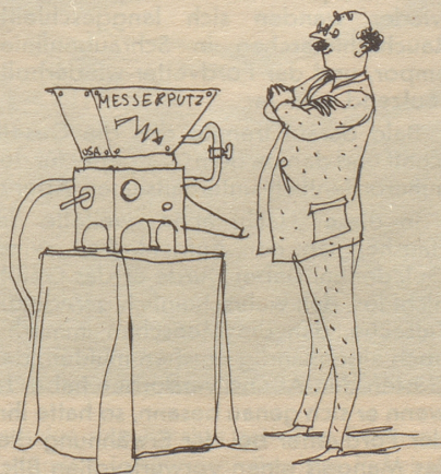
Illustrationen von Alfred Kobal

Drinne aber wetteuerte das verzweifelnde Menschlein noch ein wenig, bis es er-