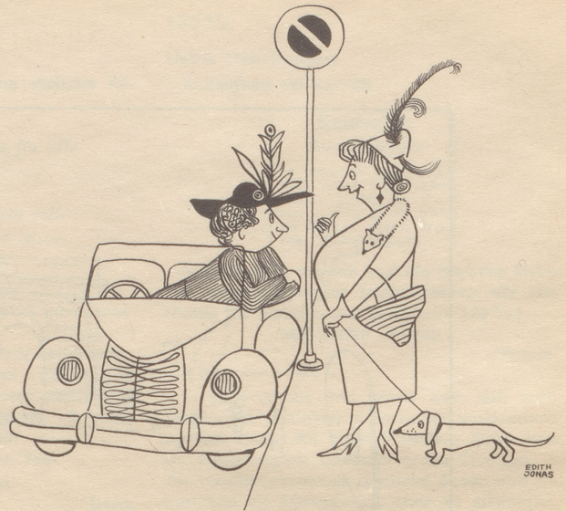
Die Dame am Steuer