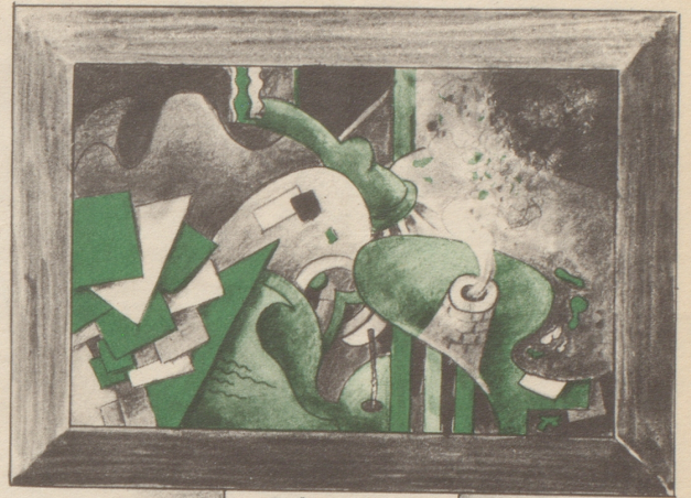
O. Birreweich „Die große Zeit“