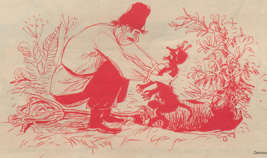
Zeichnung von Alfred Kobel

Iwan saß neben dem Loche und fragte sich, wozu denn eigentlich die Vorsehung solche Löcher geschaffen habe. Er fand keine Antwort auf diese Frage, doch grübelte er unentwegt weiter — irgend einen Sinn und Zweck mußten diese Art von Löchern doch haben! Und ihm wollte scheinen, daß die Vorsehung seine, des Bauern Iwan, Schritte nicht ohne Sinn und Zweck zu einem dieser geheimnisvollen Löcher geführt haben könne — irgendwie war doch vorge-