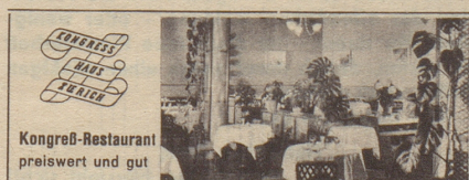
Kongreß-Restaurant preiswert und gut