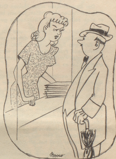
«Gällesi do im Kunschthaus isch hüt doch freie Ytritt?» «Ja, immer ame Sunntig, aber dä Schirm müendsi abgää, s choscht zwänzg Rappe.» «Jäso – nei, da chummi emal ame Sunntig wos nid rägnet!»