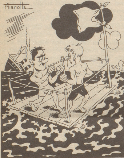
Die schiffbrüchigen Boxer