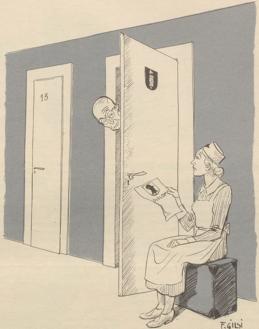
Eine Gemeindeschwester mit dem Basler Hebammen-Diplom durfte im Kanton St. Gallen nicht als Hebamme tätig sein.