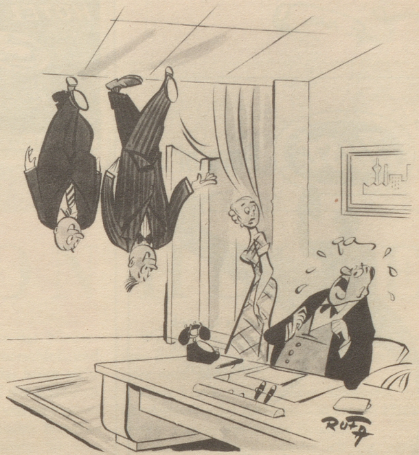
„... bitte Herr Direktor, hier kommen zwei Antipoden zu Besuch — aus Australien.“

Bedingung: Auf eine Postkarte kleben und einsenden bis 8. Juni 1953 an: Textredaktion Nebelspalter Rorschach.