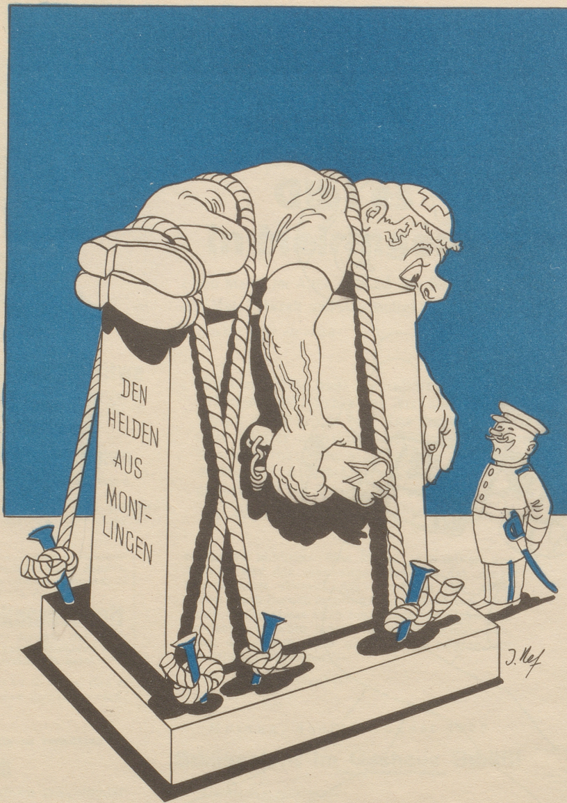
16 Schweizer führten sich in Feldkirch so schlecht auf, daß sie verhaftet werden mußten.