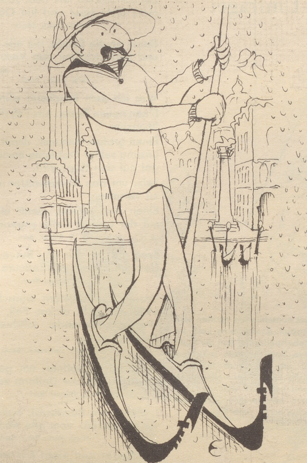
Kälte in Venedig