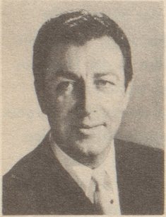
Robert Taylor, Star des MGM-Films «Das grosse Geheimnis» (Above and Beyond)

Wenn Ihre Haarpapillen den Haarboden nicht mehr vollkommen ernähren - wenn Sie unter Schuppen leiden, dann erinnern Sie sich: