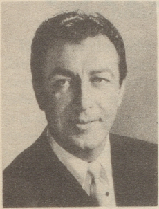
Robert Taylor, Star des MGM-Films «Das grosse Geheimnis» (Above and Beyond)

Wenn Ihre Haarpapillen den Haarboden nicht mehr vollkommen ernähren - wenn Sie unter Schuppen leiden, dann erinnern Sie sich: