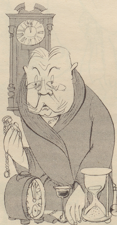
„Wie schnell das Jahr vergangen ist! Und dabei war es doch ein Schaltjahr!“