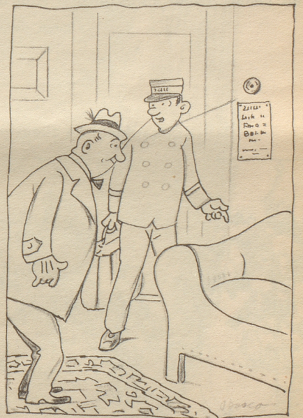
«Uf dem Sofa isch sinerzit de Goethe gsässa.»