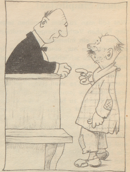
«Si händ s Urteil vernoo – zwei Joor Zuchthus – häenzi no öppis zäge drzue?»