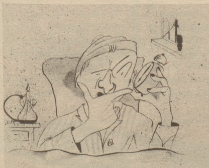
„Da isch Hueber. Wer isch am Apparat?“

Hoffentlich sind die Basler seit der Freundschaftswoche nicht so zahm geworden, daß sie nicht mehr wagen, die Zürcher aufs Korn zu nehmen! Brun