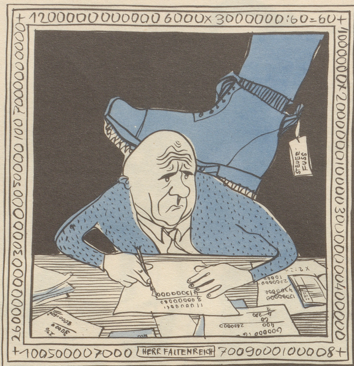
Zeichnung von Alfred Kobel