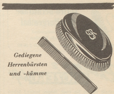
Gediegene Herrenbürsten und -kämme

Vor kurzer Zeit war ich noch ein zufriedenes Fraueli und sang die von Beromünster am meisten losgelassenen Songs, wenn ich auf der Nähmaschine die Seitennähte des neuesten Sonntagsrocks herunterstappte. Jetzt bin ich ein Vamp wider Willen mit nichts zum Anziehen. Und deshalb ist meine Ruhe hin und das Herz betrübt, und ich darf nicht einmal weinen, wegen dem Make-up. Wenn ich aber unbedingt einen Trost haben muß, dann verriegle ich die Haustüre, schließe die Läden und beim Schein einer Kerze fische ich meine lieben Gufen und den anderen Krimskrams aus dem Mistkübel und schneidere aus einem vergessenen Plätzli dem Bäbi vom Gottekind ein Röckli, denn von einem Tag auf den andern kann man sein so lange gehegtes und gepflegtes Hobby halt nicht einfach verleugnen. Deine Nanette