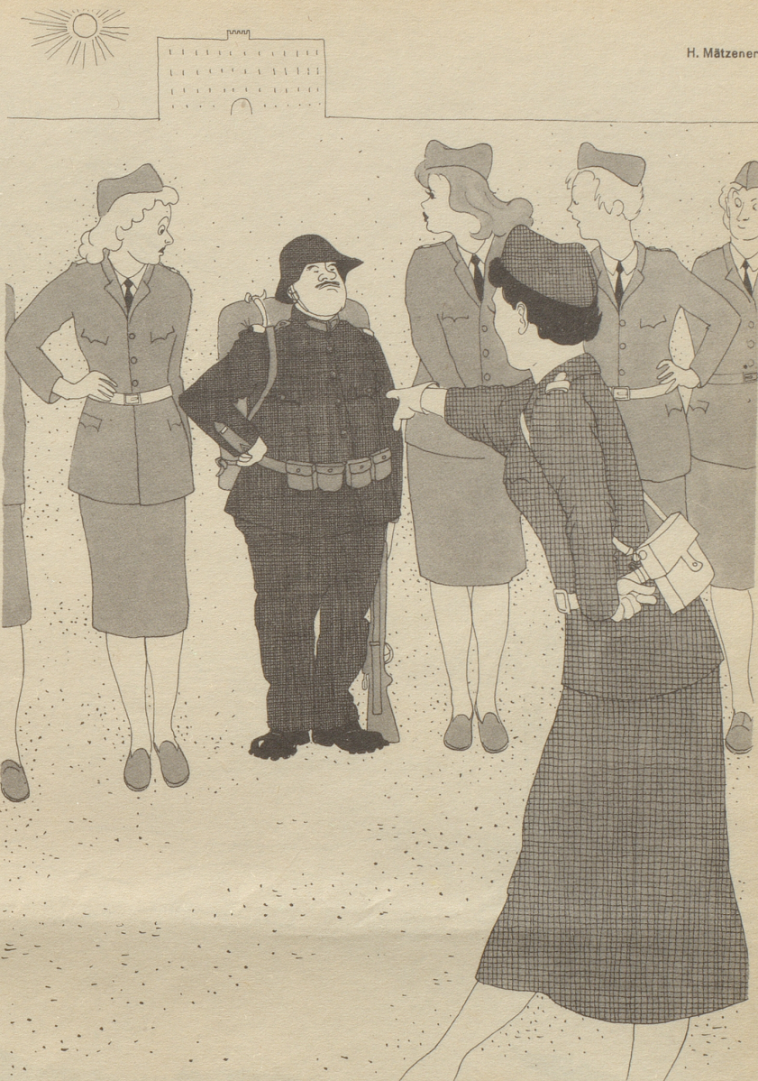
„Zeigezi emal Ihres Ufgebot!“

Vielleicht hat meine Frau mit ihrer Vermutung recht. Aber damit hat sie bestimmt recht, daß der Preis einer Dichtmaschine für mich unerschwinglich wäre. Ob es sie gibt oder nicht – ich bleibe schon ein Kleingewerbetreibender der Dichtkunst.