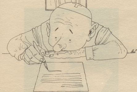
Der Bundesrat diskutierte einläßlich eine Herabsetzung der Bundessubventionen

Verehrte hööche Bundesrat, Wänn Du das machsch isch das e Tat, Für die verdiensch Du Reveränz Und sibe goldigi Lorbeerchränz. Apropos etz chunt d Überschrift: Verusgetzt das es mich nid trifft!